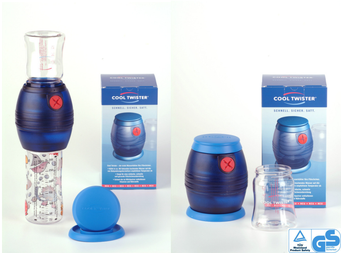
Abb. 1: Cool Twister® - System mit Fläschchen / ohne Fläschchen

Abmessungen: Durchmesser 9,5 cm, Höhe 12,5 cm