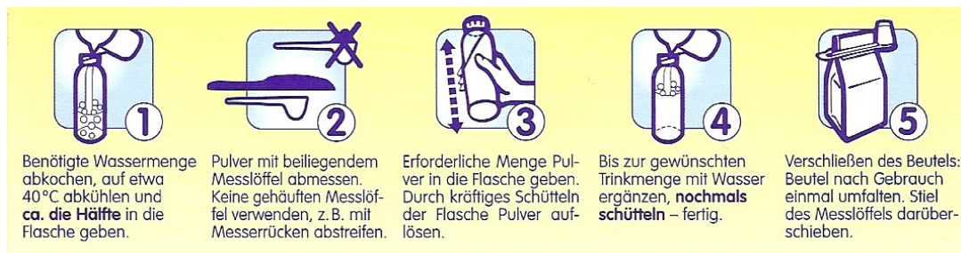
Abb. 2: Anleitung eines Babynahrungsherstellers (1) für 40 °Grad

Die speziellen hygienischen Anforderungen werden dabei erfüllt.